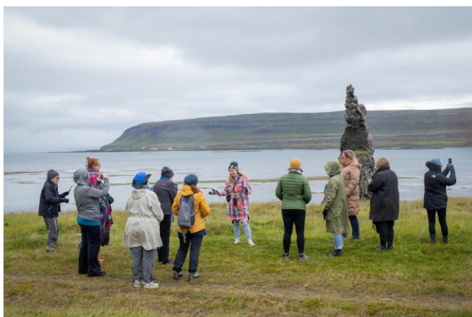
Tröllaskoðunarferð á sunnudeginum, áður en hópurinn hélt aftur suður.